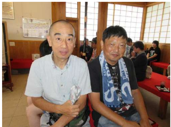
おすそわけ茶屋にて

掃除の後は隣接する「おすそわけ茶屋」でお茶をしました。コーヒーに抹茶と自分の好きな飲み物を楽しみました。こうした地域での活動はすごく意味のあることだと思います。ぜひ続けていきたいと考えています。